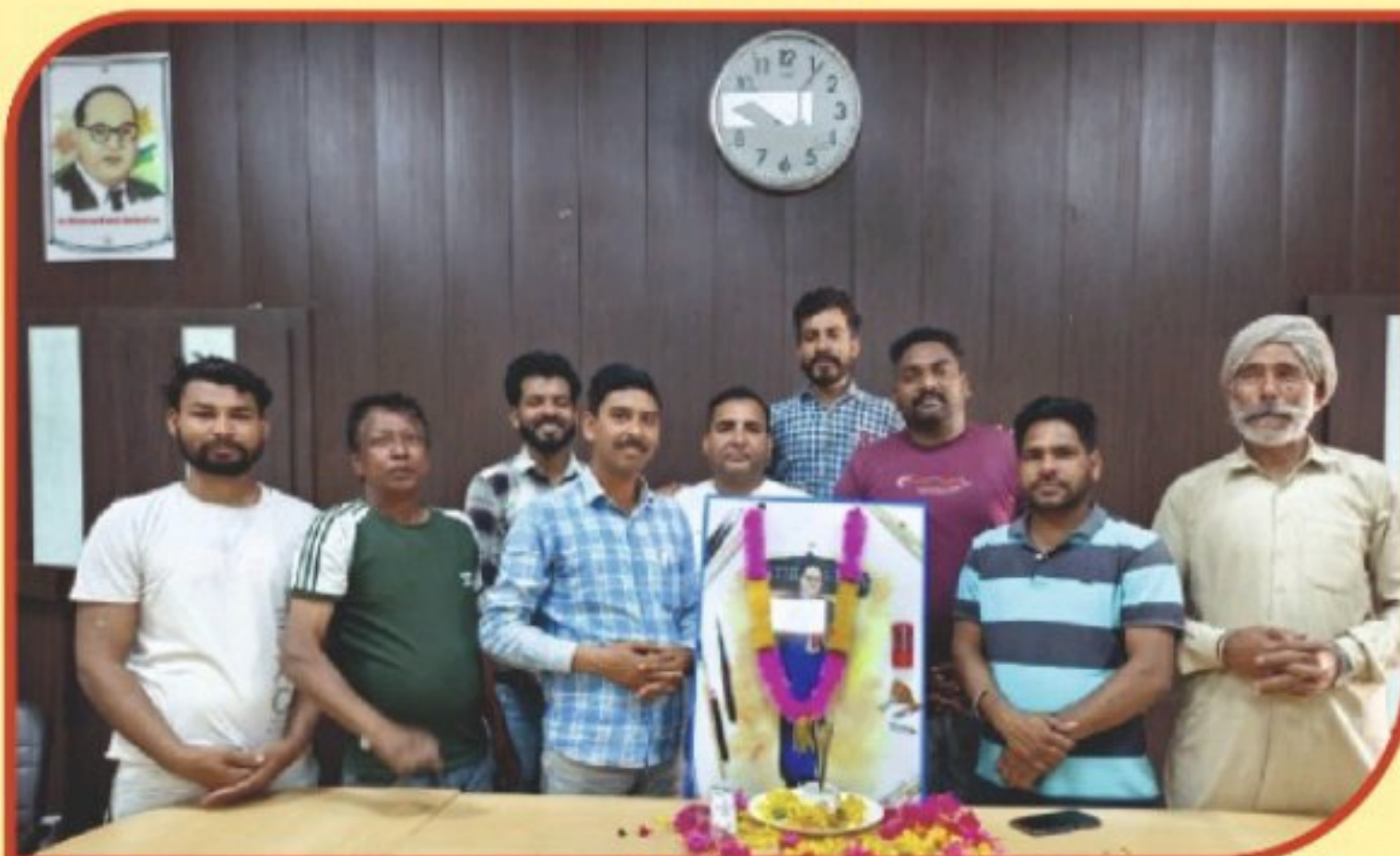
ਐਮ.ਆਰ. ਕਾਲਜ ਦੇ ਸਟਾਫ ਦੁਆਰਾ ਡਾ. ਬੀ. ਆਰ. ਅੰਬੇਦਕਰ ਜਯੰਤੀ ਮਨਾਕੇ ਅੰਬੇਦਕਰ ਜੀ ਦੇ ਨਕਸ਼ੇ ਕਦਮਾਂ ਤੇ ਚੱਲਣ ਦਾ ਪ੍ਰਣ ਕੀਤਾ ਗਿਆ।