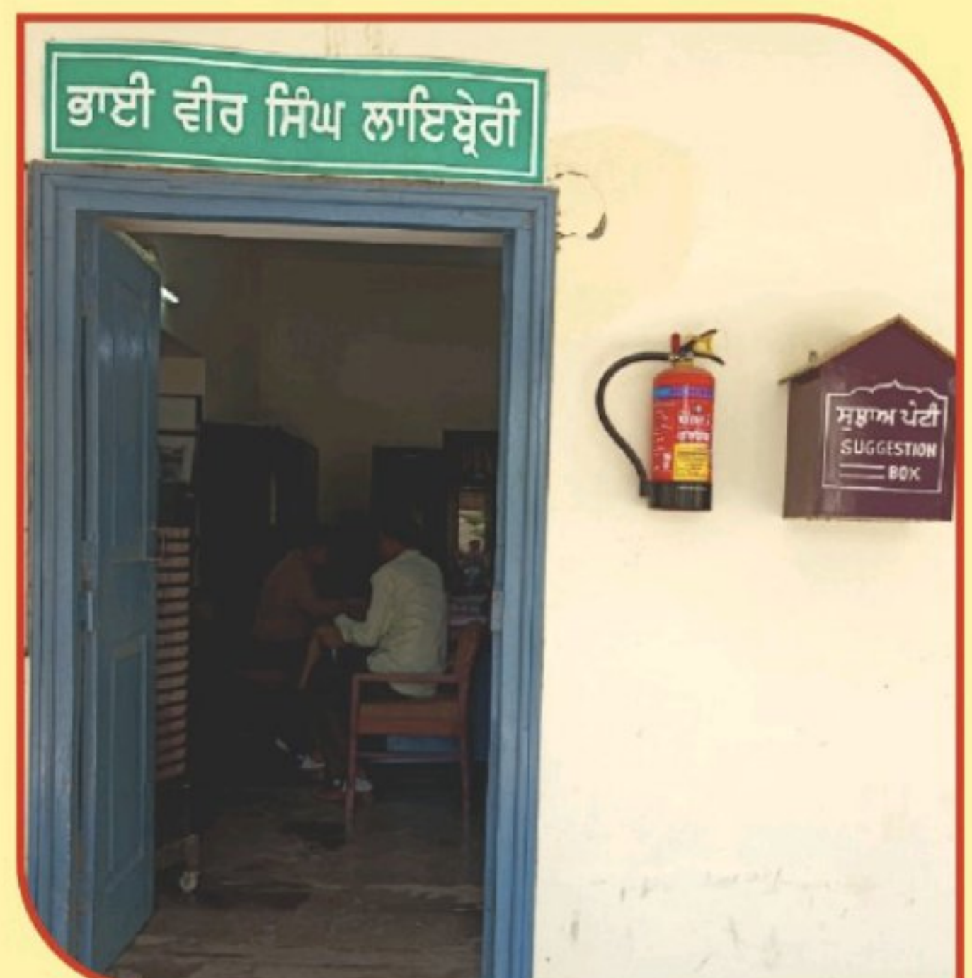
ਐਮ.ਆਰ. ਕਾਲਜ ਦੀ ਭਾਈ ਵੀਰ ਸਿੰਘ ਲਾਇਬ੍ਰੇਰੀ ਦਾ ਦ੍ਰਿਸ਼।