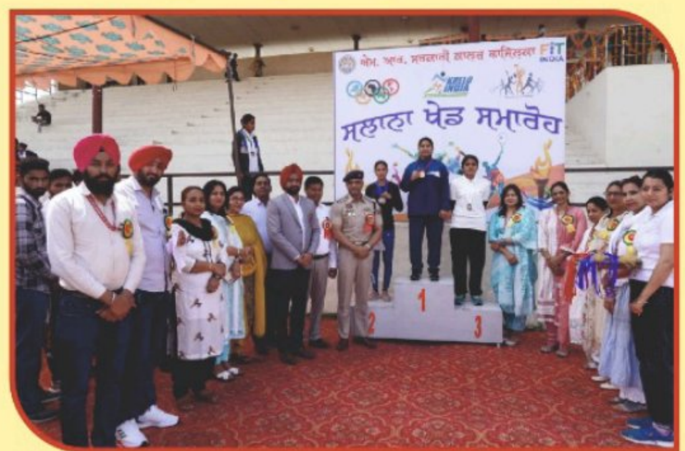
ਸਲਾਨਾ ਖੇਡ ਸਮਾਰੋਹ ਵਿੱਚ ਜਲਾਲਾਬਾਦ ਦੇ DSP ਜੀ ਅਤੇ ਸਮੂਹ ਸਟਾਫ ਵਿਦਿਆਰਥੀਆਂ ਦੀ ਹੌਂਸਲਾ ਅਫਜਾਈ ਕਰਦੇ ਹੋਏ।