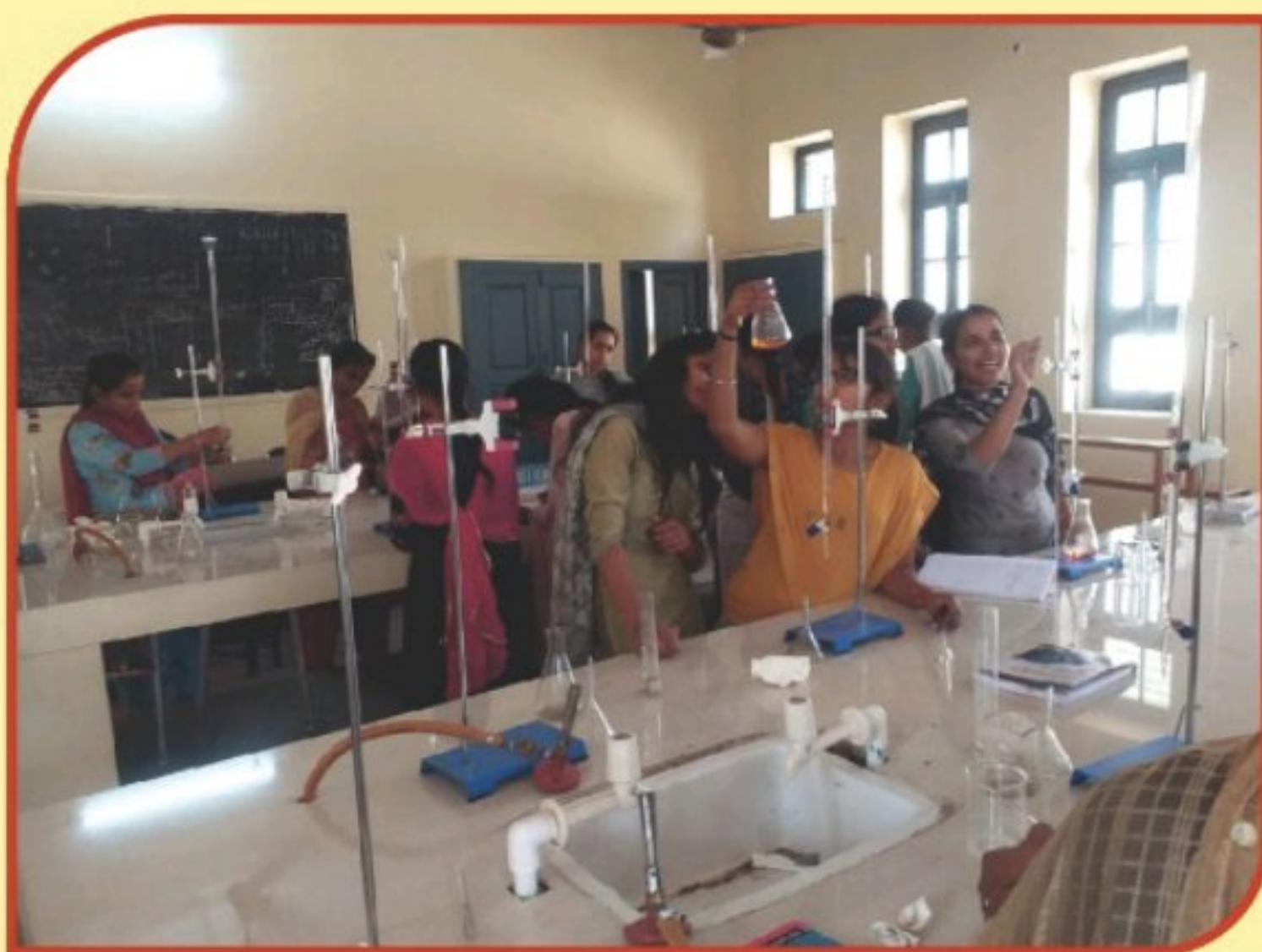
ਐਮ.ਆਰ. ਕਾਲਜ ਦੀ ਕੈਮਿਸਟਰੀ ਵਿਭਾਗ ਦੀ ਲੈਬ ਵਿੱਚ ਵਿਦਿਆਰਥੀ ਪ੍ਰੈਕਟਰੀਕਲ ਅਭਿਆਸ ਕਰਦੇ ਹੋਏ।